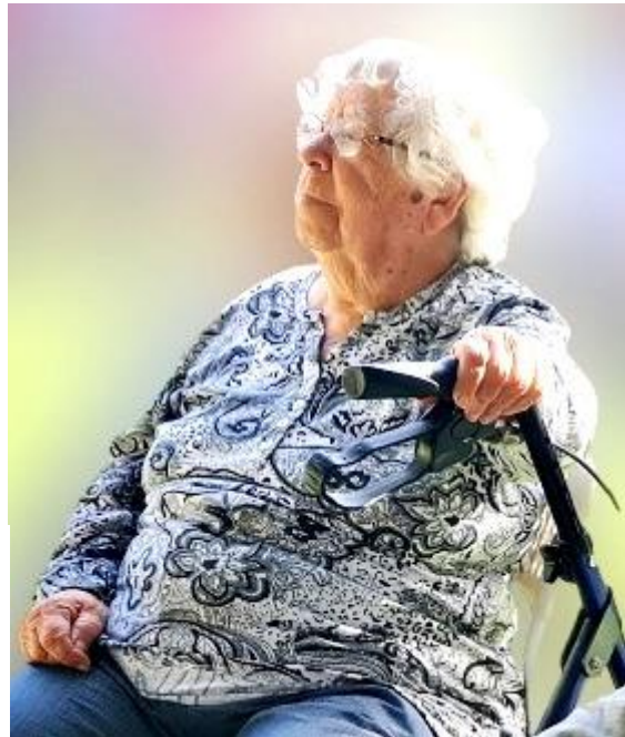
צופה פני עתיד...

עכשיו כבר מגיעה לה קצת שלוה היא חיה פה מוקפת אהבה לא לכל השאלות יש לה תשובה אך עדיין היא אופטימית ומקווה. היא פוקחת עיניים כל יום ללא חשש היא יודעת שכל יום מביא דבר חדש. כי היו לה ויש לה חיים נפלאים יאללה סבתא תמשיכי לעוף על החיים!