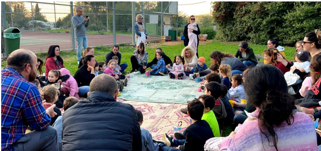
ילדי גן זמיר וההורים במסיבת חנוכה בגן יער