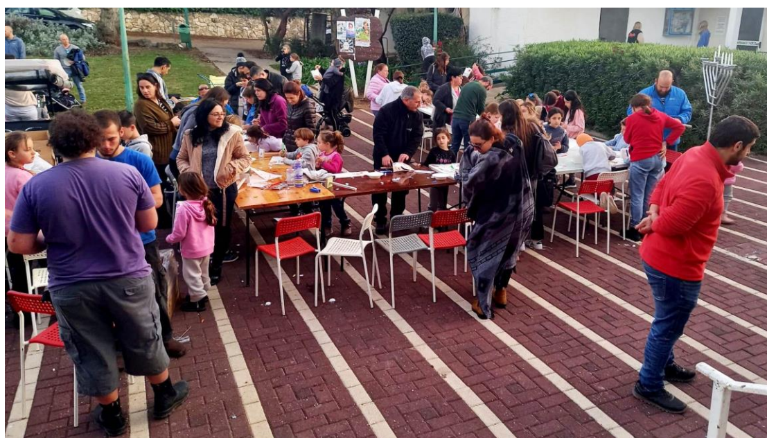
תהלוכת למפיונים. מכינים וצועדים

את חג החנוכה חגגנו בצעדת הלמפיונים המסורתית והדלקת נרות קהילתית רב דורית, אשר האירה את הקיבוץ. תודה רבה לנערים שעזרו לארגן ולבצע את האירועים האחרונים.