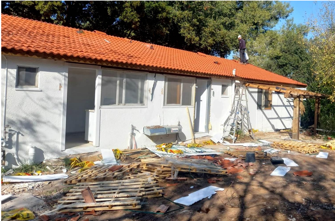
שיפוץ 6 יחידות דיור. בתי כגן משנים את פניהם