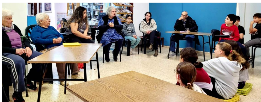
ילדי שקד מארחים את המבוגרים