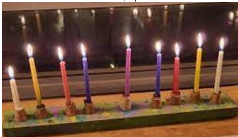
(המשך בעמ' 12)