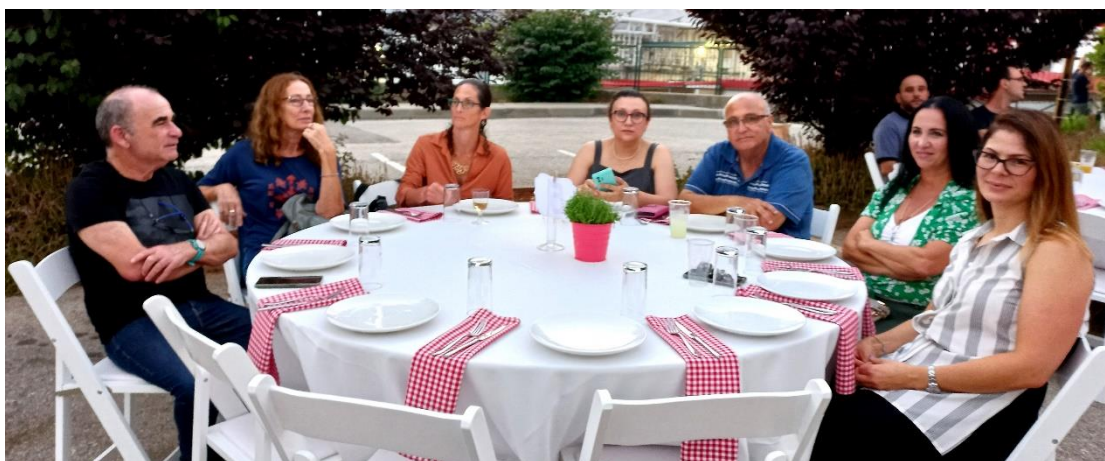
אנשי המפעל בערב גאלה