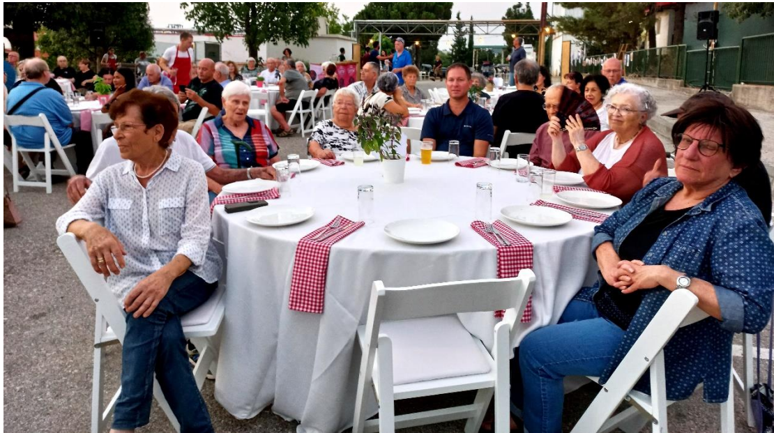
חברים בערב גאלה