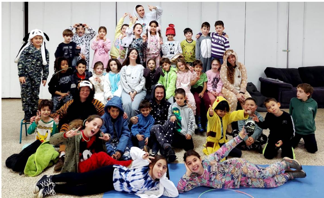
ילדי תמר חוגגים