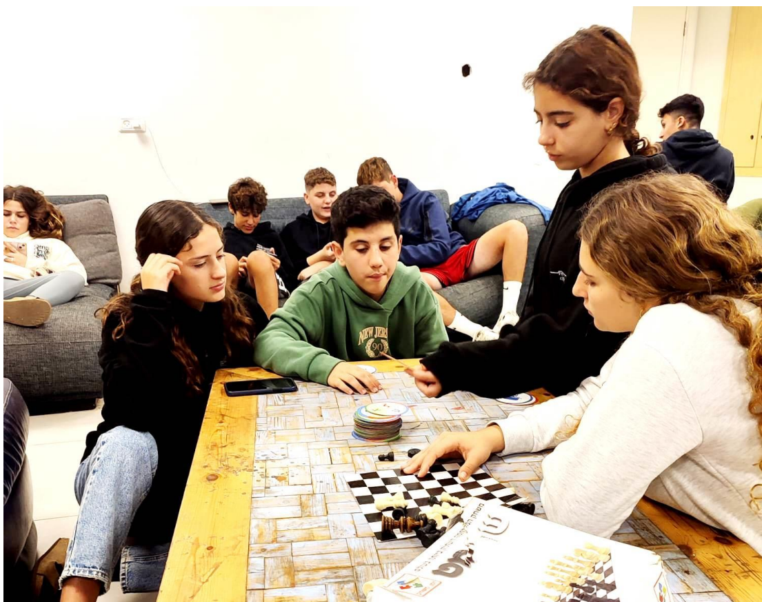
הנעורים בפעילות במועדון