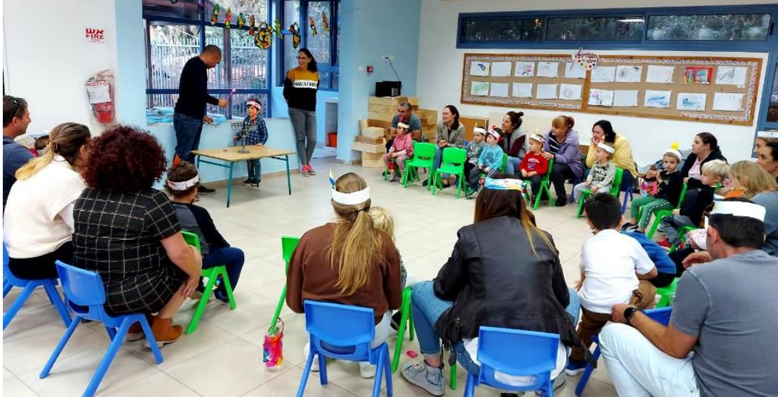
מסיבת חנוכה עם ההורים בגן דרור

בכל הגנים חגגו את חג החנוכה, הדליקו נרות עם ההורים והכינו לביבות.