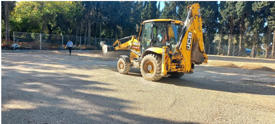
מגרש הכדורגל בעיצומה של העבודה