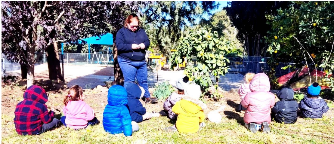
ילדי גן אנקור, עטופים במעילים, מחכים לגשם

לאחר החגים נכנסו גני הגיל הרך לשגרה נעימה, שכוללת טיולי בוקר וטבע, משחק בחצר ועם בוא החורף טיולי חורף ושלוליות.