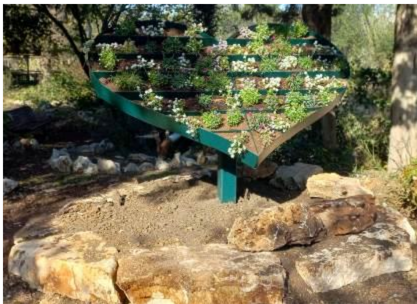
(המשך בעמ' 4)

אנחנו בחרנו להציב את הלב בכניסה לגן איתן, גן הקיימות. כן התקבלו המועצה 3 ספסלים שהוצבו בגן השעשועים ו 3 פחי אשפה קטנים.