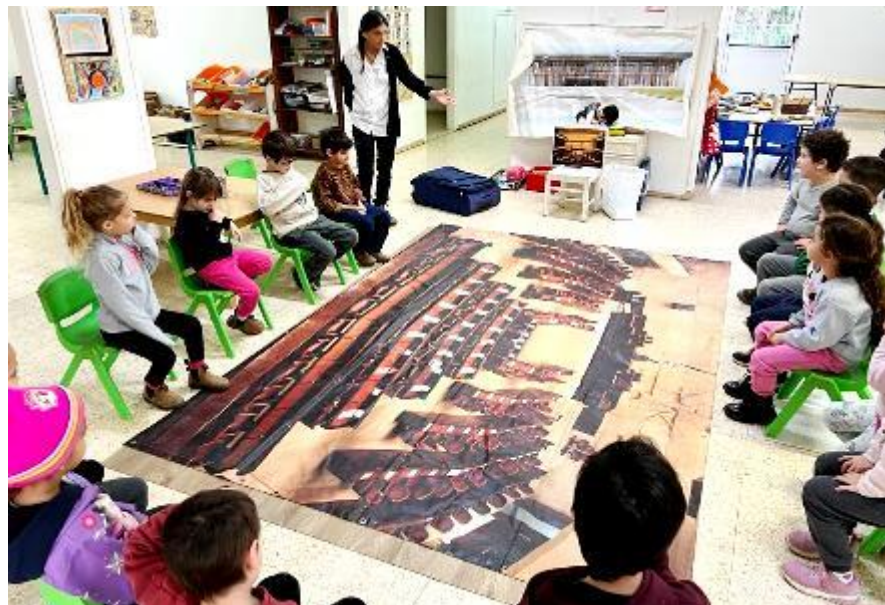
ילדי גן זמיר לומדים על כנסת ישראל