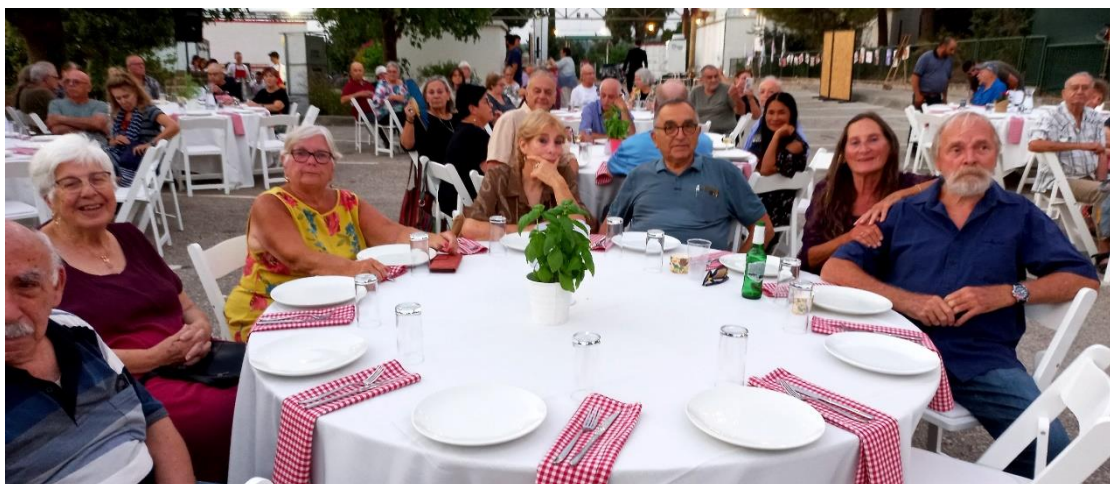
(המשך בעמ' 20)

בכל זאת, ידענו והצלחנו לפעול באופן כזה, שלא נוצר משבר תעסוקתי, לא נפגעו המכירות בשוק המקומי, אלא להיפך, גדלו ולא נעצרו פעולות ההשקעה והפיתוח.