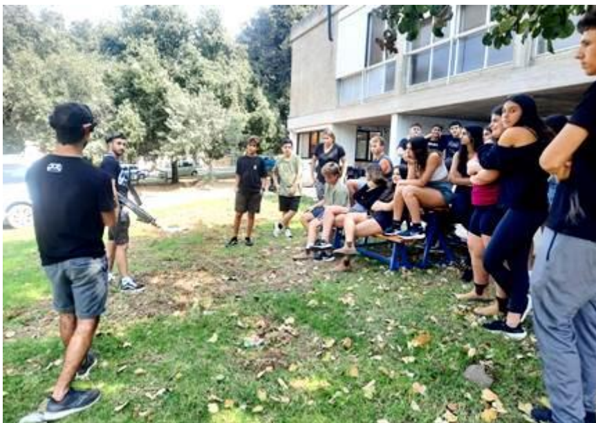
(המשך בעמ' 14)

עוד בחופש הכינו הנערים ארוחת ערב משותפת ובסופ"ש יצאו לפעילות שיא לייזרטאג.