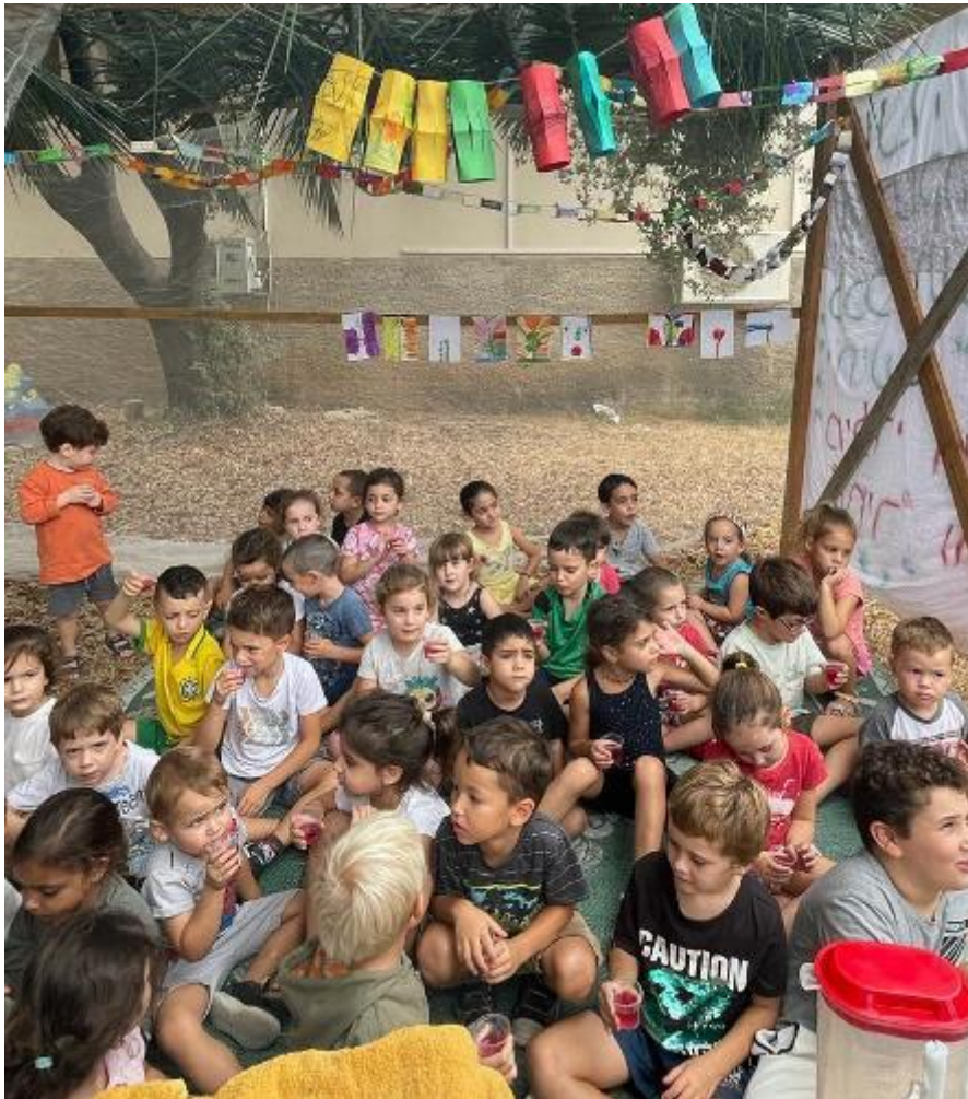
ילדי הגנים זמיר ודרור בסוכה שהקימו עם השינ"שינים

עכשיו בשעה טובה מתחילה השגרה הארוכה ואנו מאחלים שנת שגרה טובה, מהנה ובטוחה, לכולם.