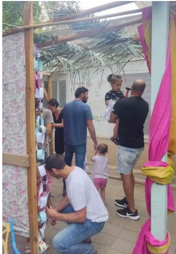
ילדי גן אנקור בונים סוכה עם ההורים

במסגרת החינוך פועלים גם השנה ארבעה גנים, בהם מתחנכים 90 ילדים. ב מהלך החגים ציינו בגנים את כל החגים והמועדים, הכינו יין מרימונים, בנו סוכות וחגגו.