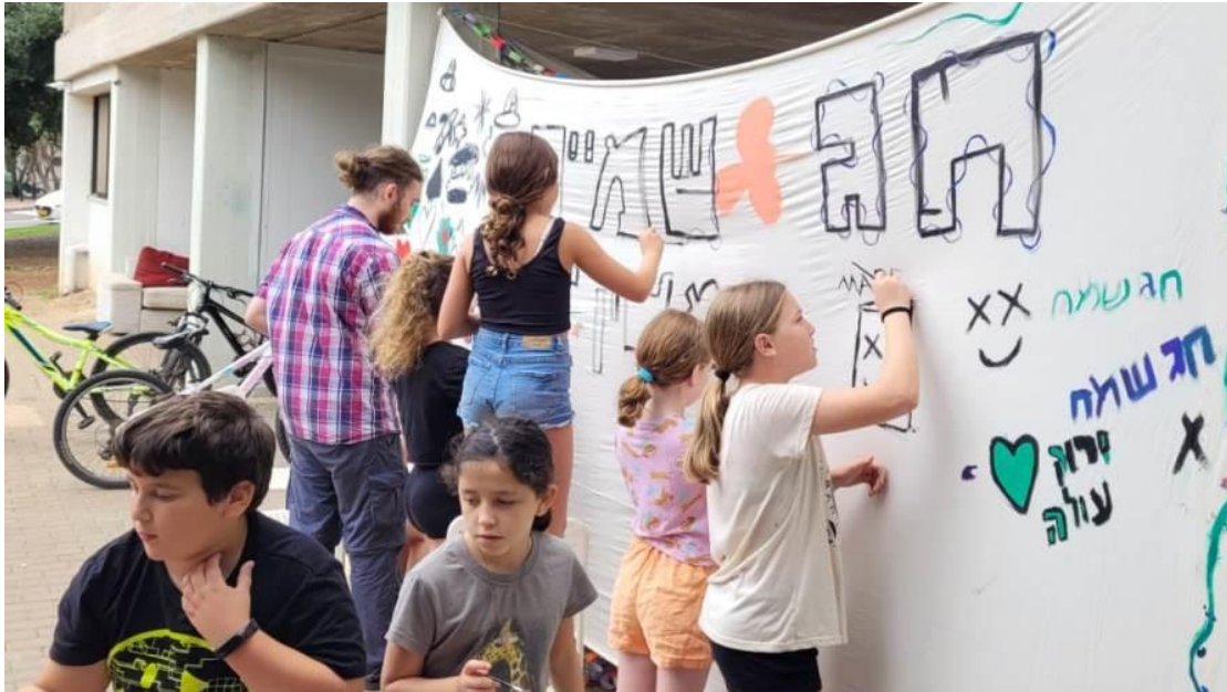
ילדי מרכזון שקד מברכים