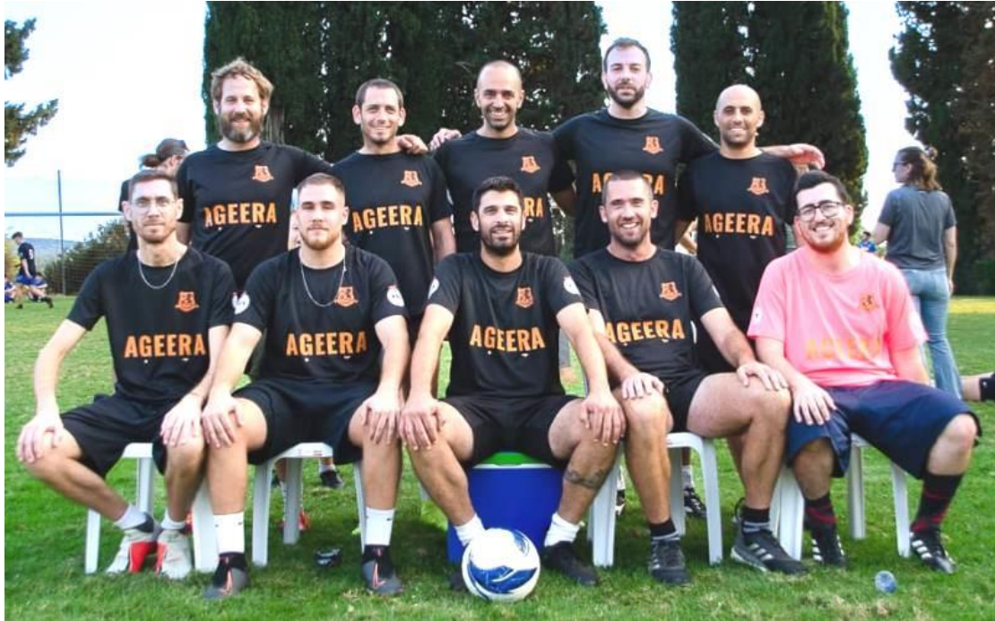
”תגידו כן לכדורגל הוגן.”

תודה מיוחדת לקהל המדהים שלנו שמלווה אותנו בכשלונות ובכשלונות. נחזור חזקים יותר בשנה הבאה ונחזיר את הגביע ליחיעם! תודה רבה למשתתפים הרבים ולשלומית וילמוש, שהגיעה, כיבדה בנוכחותה והעניקה את הגביע לקבוצה המנצחת.