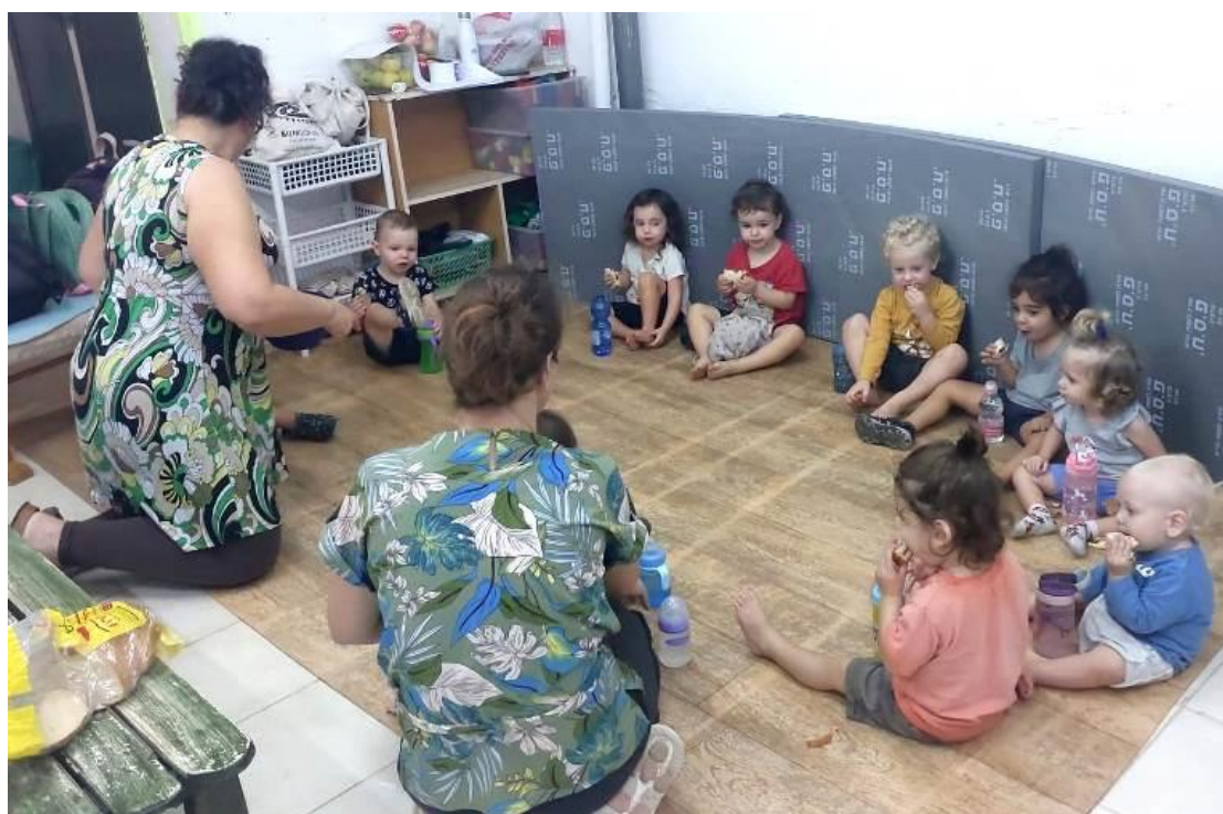
(המשך בעמ' 18)

לקראת סוף חודש אוקטובר התחלנו לקיים פעילות הפוגה במקלט, לילדי הגיל הרך והגנים, בהנהלת לימור טויטו, אגם הרשקו ואלונה מושקוב, בהשתתפות הורים. קראנו לזה מקלטון.