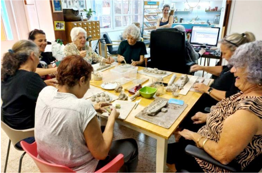
חוג קרמיקה. יצירה ומפגש חברתי