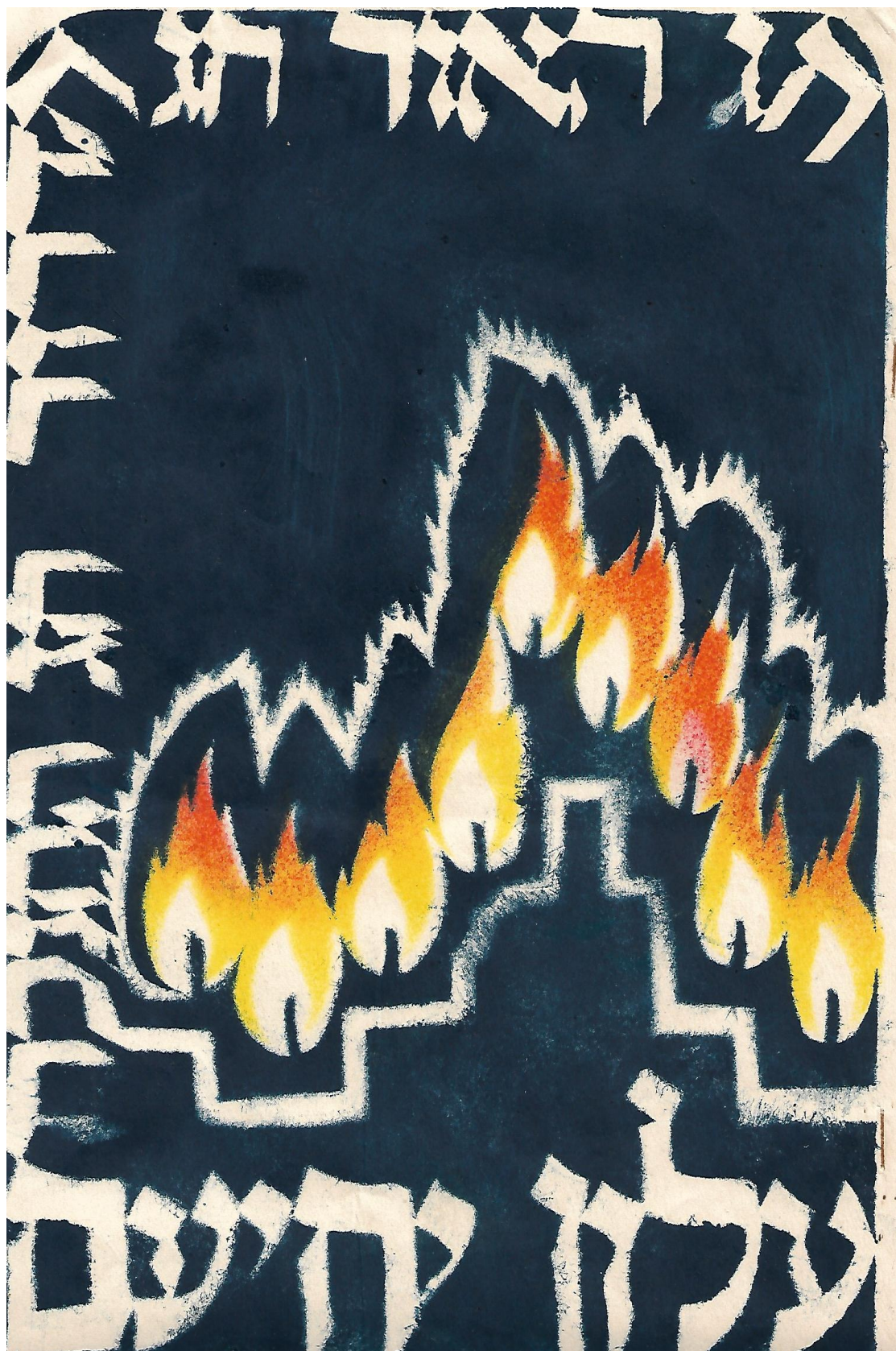
עלון יחיעם חנוכה 1952