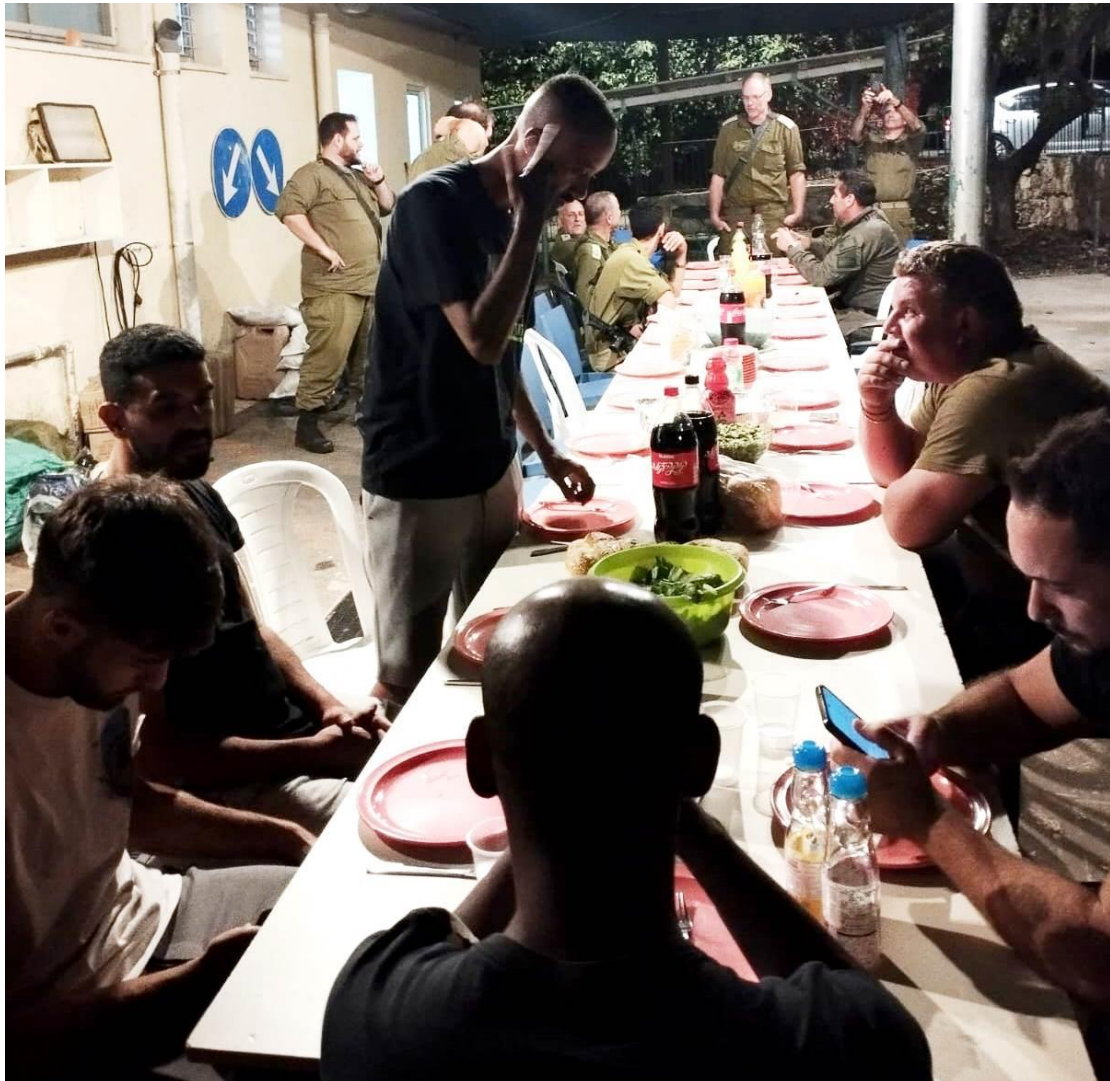
ארוחת שישי מכל הלב

עד לפני ימים אחדים שהו בקיבוץ יותר ממאה חיילים. 20 מפלוגת שינוע, גדוד יחסי"מ, חטיבה 205, שהתגוררו במבנה של המכונה ורבים נוספים ששהו בחדר האוכל ובמבנים נוספים ברחבי הקיבוץ. חברים רבים מאד ובעיקר חברות, התגייסו ונרתמו לטיפול צמוד בחיילים, הכנת אוכל, כביסה ודאגה לכל צרכיהם. זו היתה פעולה ספונטנית מחממת לב ומעוררת השראה.