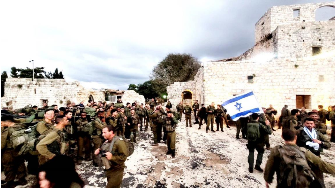
גדוד 21 חטיבת כרמלי במבצר יחיעם 2023

מספר צבי גרשון ז"ל, שהיה מפקד הנקודה בזמן מלחמת השחרור והמצור. (מתוך הספר "חטיבת כרמלי במלחמת הקוממיות" +):