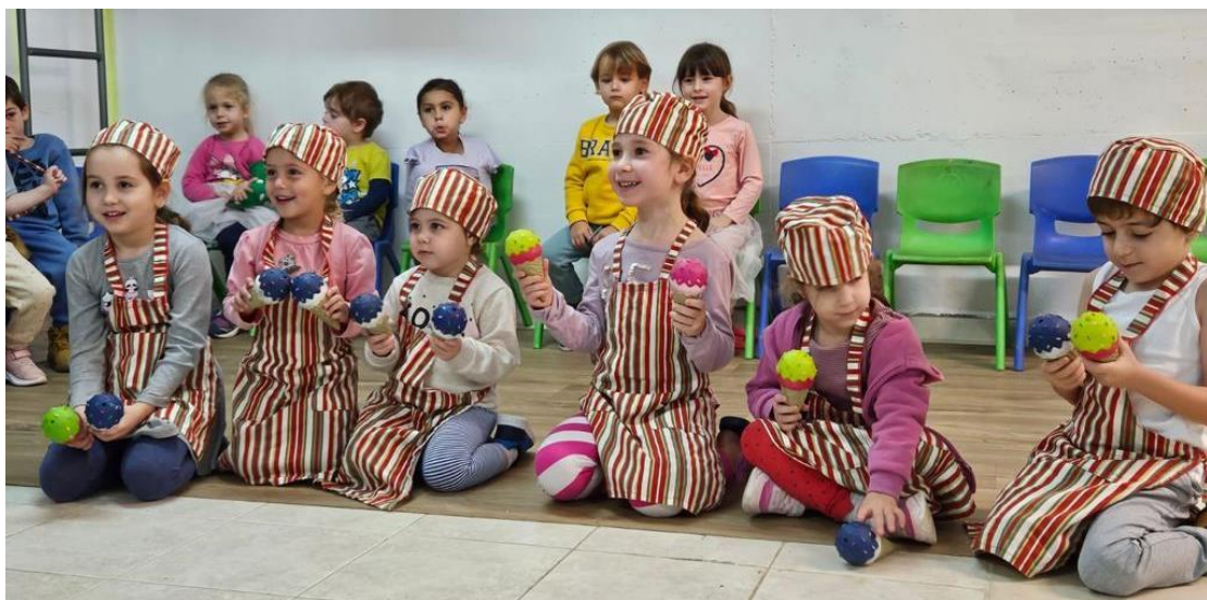
(המשך בעמ' 20)