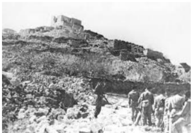
גדוד 21 חטיבת כרמלי במבצר יחיעם 1948

כמו כן יצא גדוד 21 של חטיבת כרמלי, ב 27.3.1948 ללוות את השיירה העולה ליחיעם. 47 מלוחמי ולחמות הגדוד נפלו בהתקפה על שיירת יחיעם.