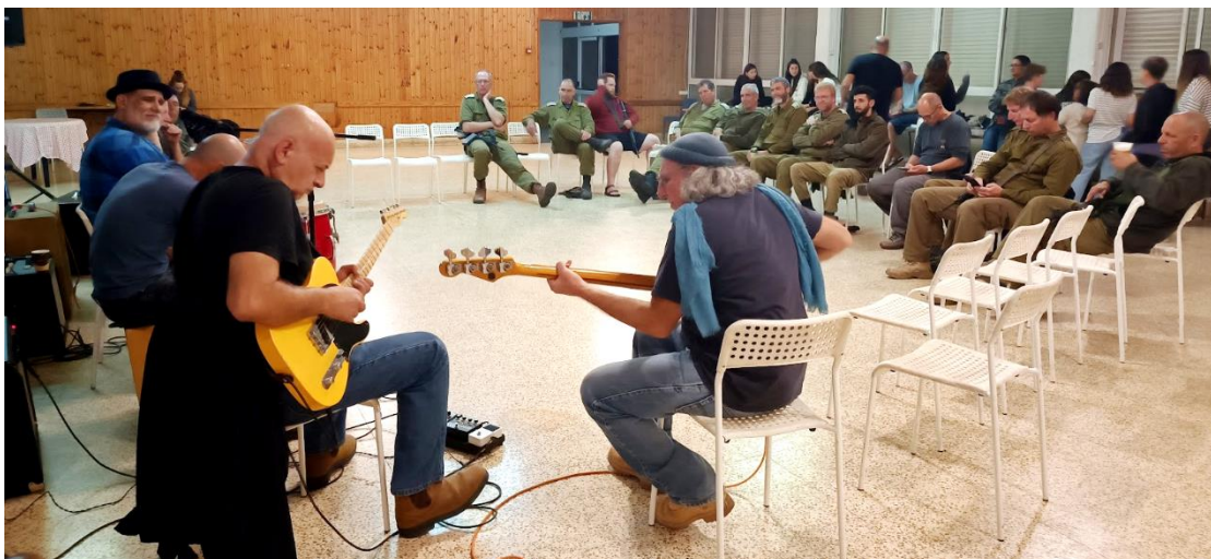
להקת בלובנד הגיעה בהפתעה, להופיע בהתנדבות בפני החיילים ואנשי הקיבוץ. (המשך בעמ' 28)

סדנת פלונטר לילדים ומבוגרים - משחקי חשיבה מאתגרים ומחברים, ללא מסך. הכל דרך משחק חברתי. עומר יפת - פיינליסט הכוכב הבא, הגיע במיוחד בשבילנו בהתנדבות לערב הפוגה רגוע עם מוזיקה איכותית והרבה טוב על הלב. תודה לרומי האלופה שהביאה את עומר והרימה את הערב המקסים שהיה.