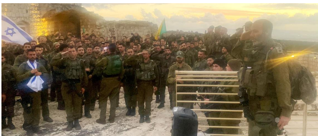
טקס מרגש על מרפסת המבצר