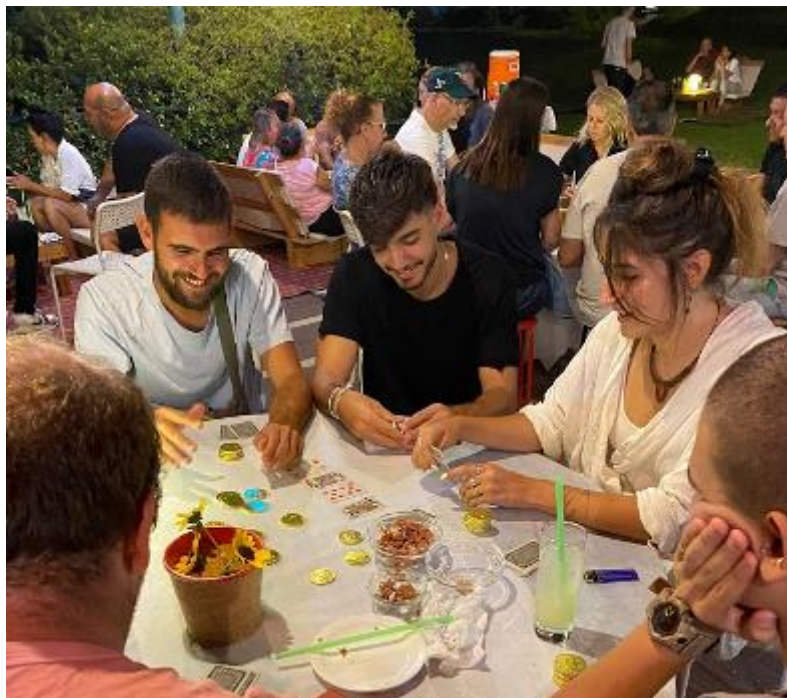
(המשך בעמ' 30)