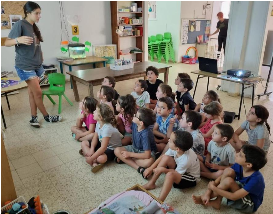
גן זמיר בתחנות שונות של פעילות.