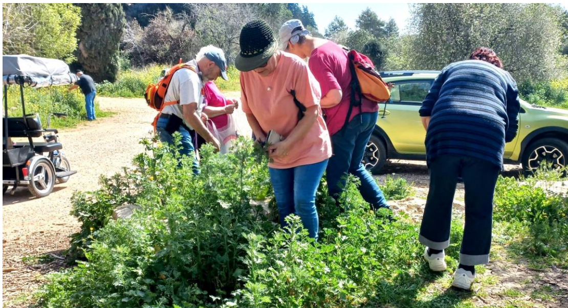
יום ליקוט. פעילות מלמדת ומגבשת

הפעילות, שאיננה זולה, מתוקצבת מתוך תקציב הקהילה + קרן פפה - 22.000 שקל ומהמועצה האזורית - 8,000 מול קבלות וחשבונות. בנוסף משתתפים האנשים בתשלומים אישיים בחוגי מועצה, בהסעות לטיולים 60 שקל לאדם ובעלות ארוחות צהריים.