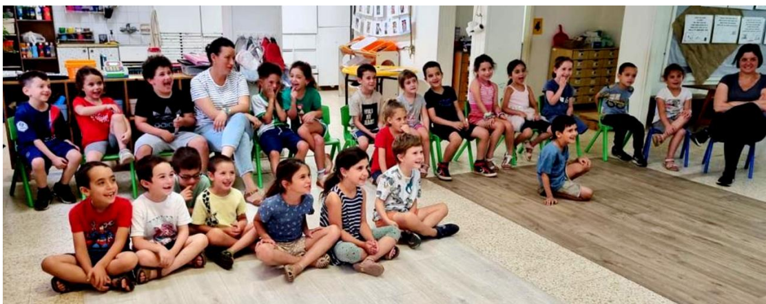
(המשך בעמ' 16)