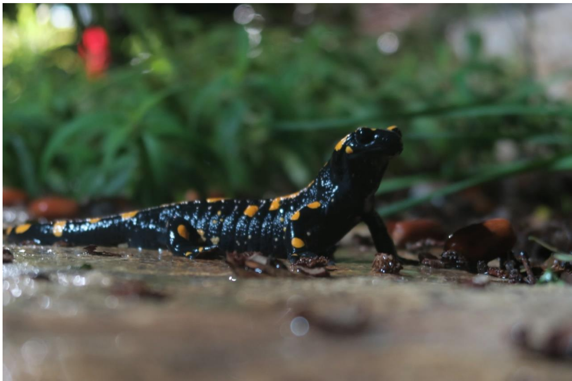
צילומים מתוך הקטלוג