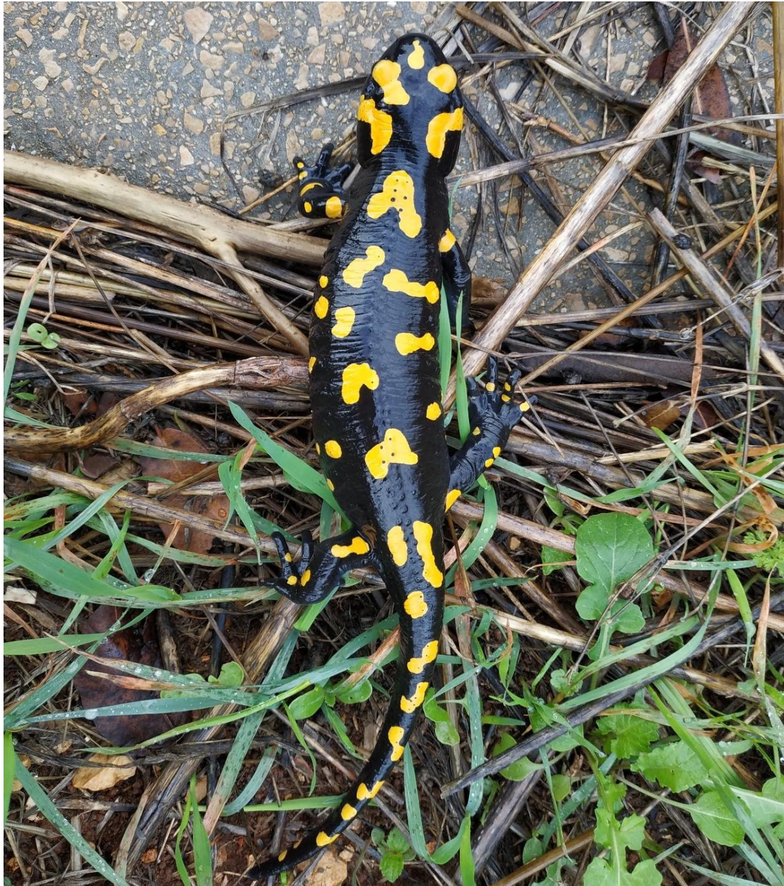
צילומים מתוך הקטלוג

ואז יום אחד באמת ראיתי שתי סלמנדרות, כנראה בחלק מתהליך ההזדווגות. כבר לפני שנה צילמתי סלמנדרה אצלי בגינה ושלחתי לו את התמונה ושוב עוד כמה פעמים, אבל זה לא באמת תפס אותי. עד השנה".