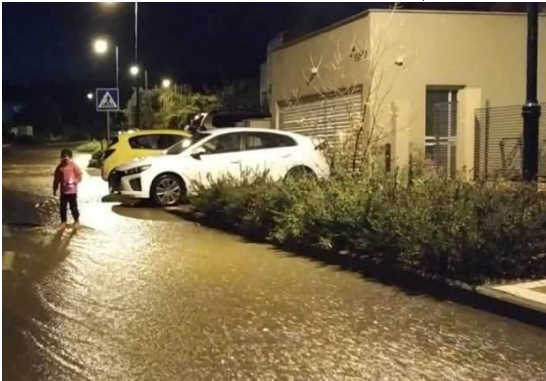
שבירת שיא המקום השלישי. אירוע הגשם לפני שבועיים.

אמיר, שכבר נשבה לחלוטין באהבת התחום, הספיק לארגן לעצמו את כל הנתונים בטבלאות מסודרות ויודע לערוך את ההשוואות המתבקשות מול מזג אוויר חריג כפי שחווינו לאחרונה. "יחיעם זה מקום מיוחד", הוא מציין, "גם מבחינת השירות המטאורולוגי, בגלל רצף הנתונים האמין לאורך שנים. באירוע הגשם של לפני שבועיים", הוא מפרט, "ירדו ביחיעם ביממה אחת 131.7 מ"מ גשם. זו כמעט שבירת שיא, זה היה אירוע הגשם השלישי הכי משמעותי מאז תחילת המדידות ביחיעם, מבחינת כמות משקעים".