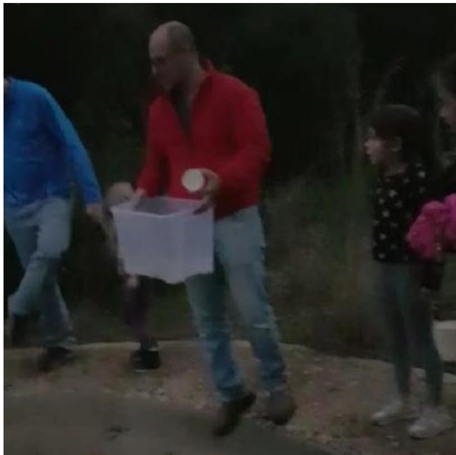
(המשך בעמ' 20)

בשעה ארבע באותו אחר בצהריים אירגנו לה אנשי החיבולנס הסעה לבית החולים. בדרך היא השריצה עוד 7 ראשנים. בספארי אמרו שאין להם איך לעזור לה והכי טוב להחזיר אותה למקומה. באחת-עשרה בלילה היא כבר היתה פה בחזרה ביחיעם. יחד עם מתנדבי חיבולנס, ניר נדיבי ובעז בקר, שהגיעו ליחיעם בדחיפות, השבנו את הסלמנדרה לבריכת הסלמנדרות העכשווית.