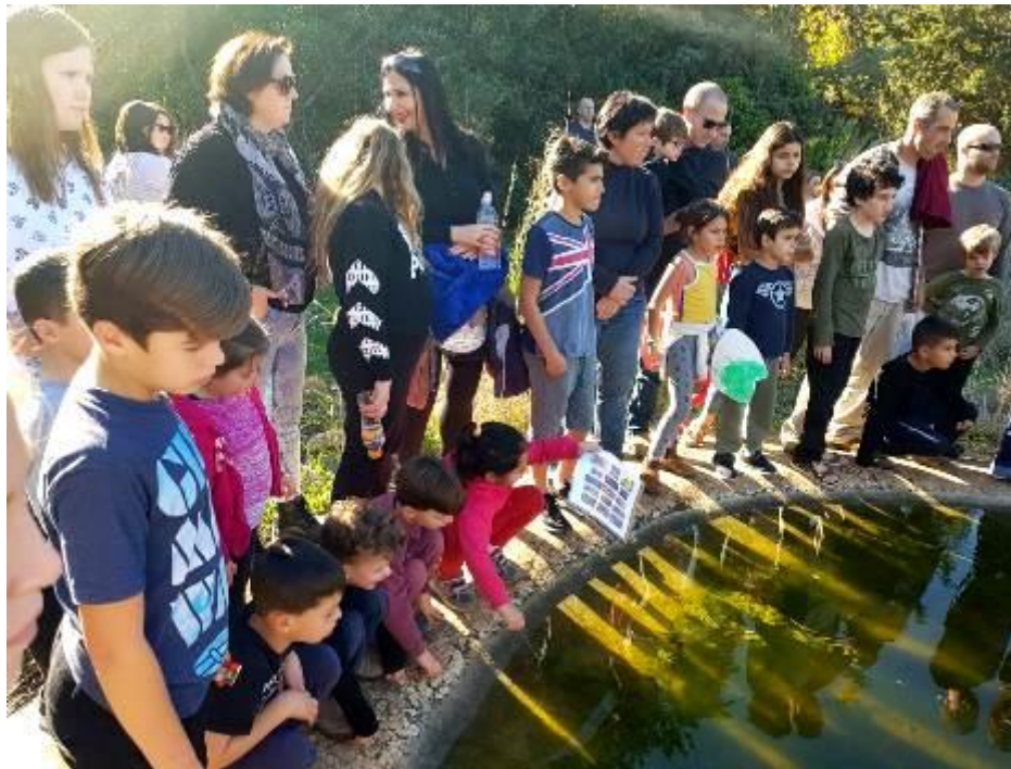
סיור היכרות בבריכת הסלמנדרות

אם פגשת סלמנדרה על הכביש ואין לך זמן או אפשרות להישאר לשמור עליה, אתה מוזמן להיכנס לקבוצת הווטס'אפ ולקרוא למישהו שפנוי לבוא עכשיו לשמור עליה. אם לא בא אף אחד, להרים אותה, להזיז אותה 5 מ' מהכביש, ולא לשכוח לצלם.