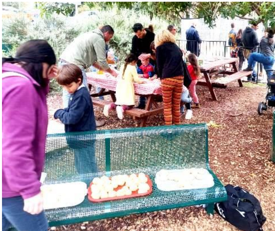
(המשך בעמ' 22)