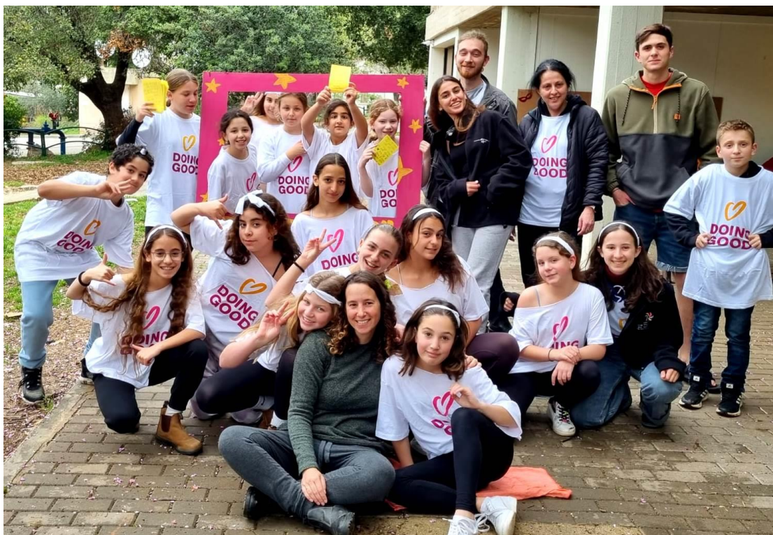
יום המעשים הטובים מרכזון תמר