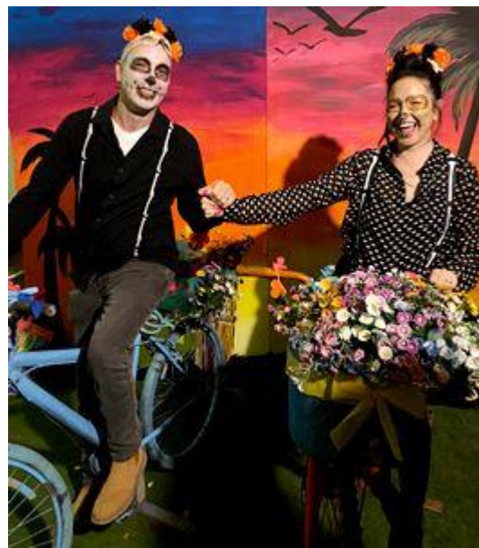
(המשך בעמ' 24)