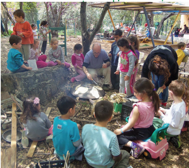
אפיית מצות על טבון בגן זמיר