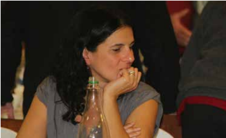
רגע של מנוחה