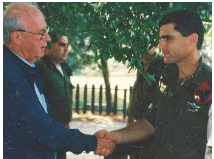
שחר (עם רבין)