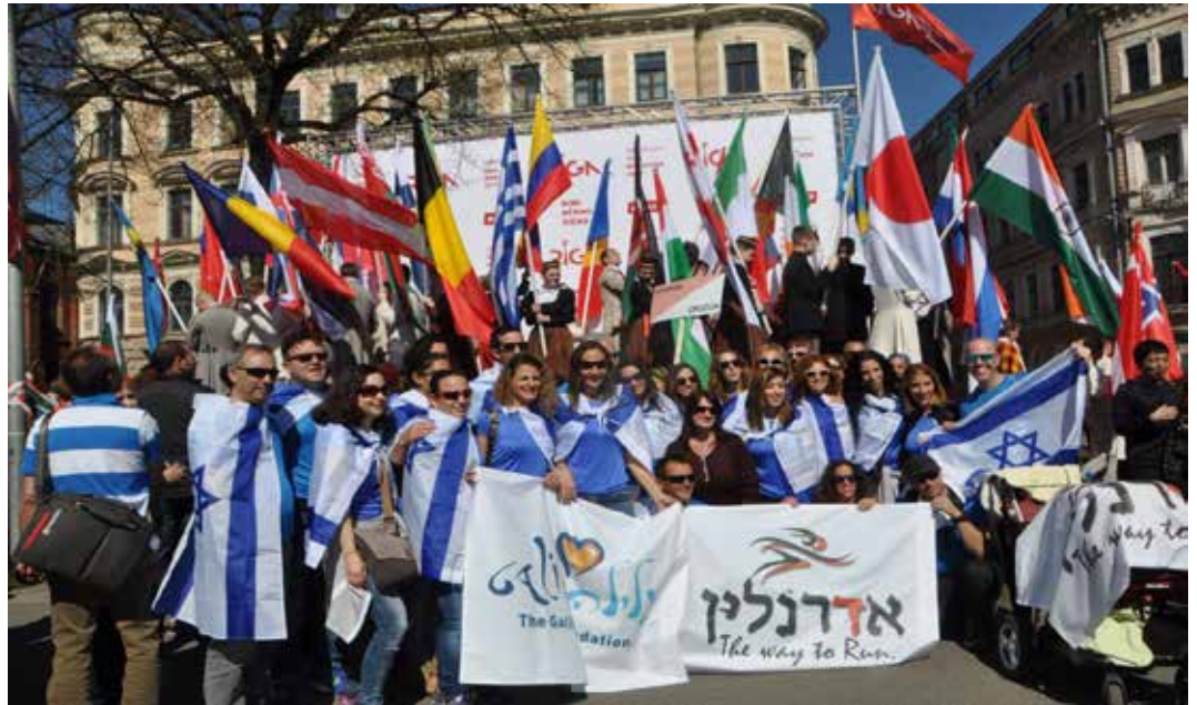
מצעד הדגלים בריגה

הערכה מהסביבה. אני יותר אסרטיבית. יותר אומרת מה אני רוצה ופחות מסתרת. יותר מחוברת ואוהבת את הגוף שלי. זכיתי בהעצמה ובעיקר זכיתי בחברים חדשים, מקסימים". היעד הבא מרתון ורשה, לציון 70 שנה לישראל. בהצלחה רבה לריקי ולחבריה הרצים מיחיעם ובכלל.