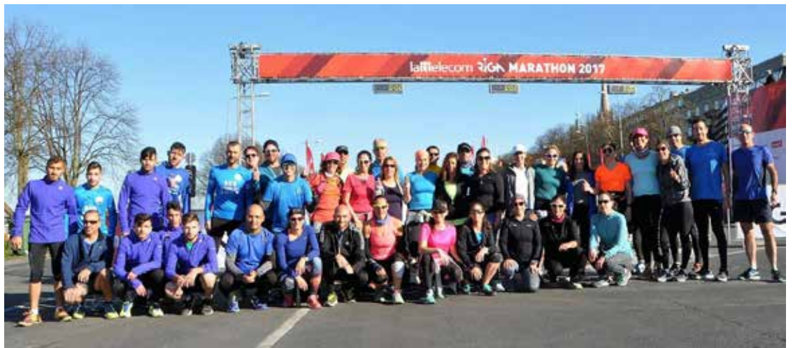
מרתון זה אירוע חברתי. הקבוצה

אבל כשאנשים מסיימים את הריצה ואומרים לך, בזכותך השגתי את התוצאה ששמתי לעצמי, זה שווה הכל".