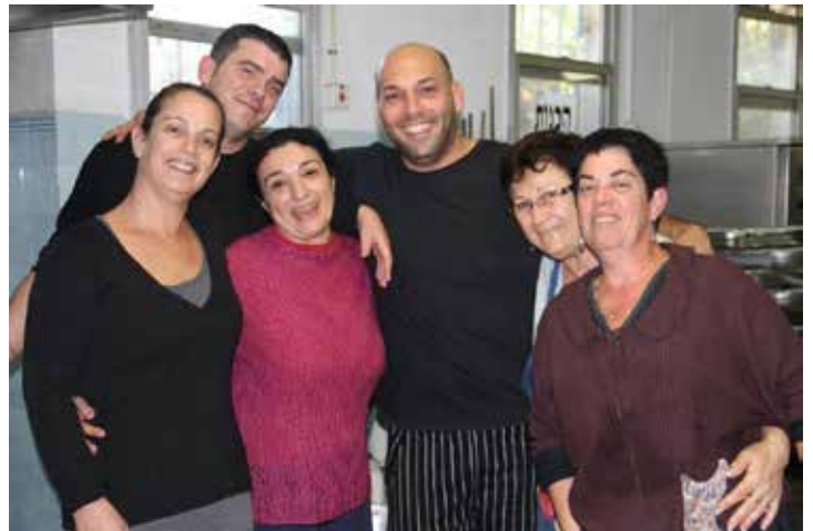
שוב עולים מהמטבח ריחות של פעם