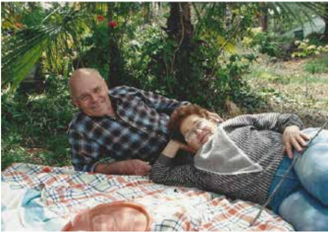
יאיר ורבקה בימים טובים

גילה הציעה לנו לכתוב קורות חיים ואני כמובן, נענית.