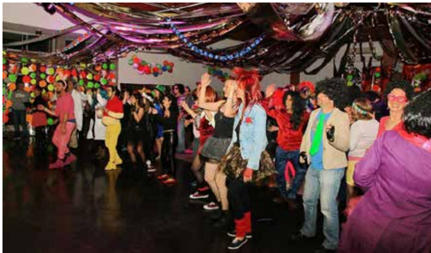
למעלה: פורים למטה: הכנת קישוטים לחנוכה. חגים ששומרים על צביונם

בנוסף, פניתי לבני קיבוץ ואמרתי להם שכל אחד צריך