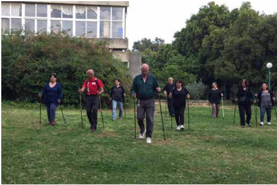
הולכים כל הדרך אל הבריאות

אז ניסינו. השנה למשל, עשינו שבוע בריאות, שכלל המון פעילויות שונות, שכמעט כל אחד היה יכול למצוא בהן מה מתאים לו.