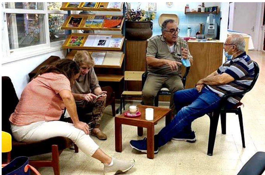
בפנים, או בחוץ, אספרסו, או הפוך. קפה ומאפה וגם מפגש רעים