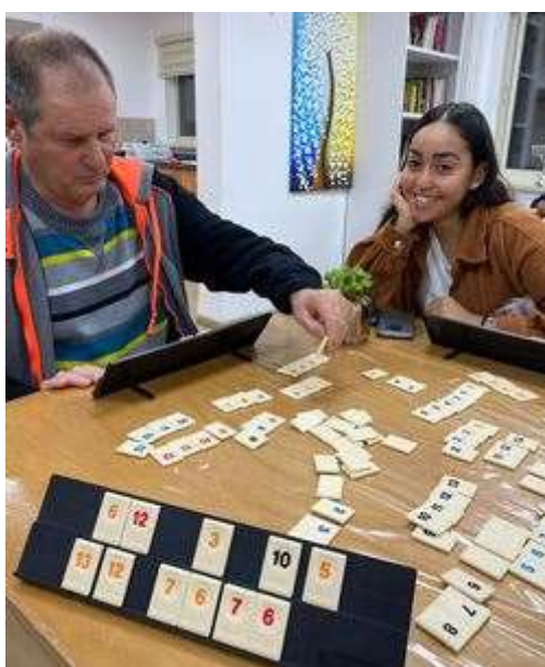
(המשך בעמ' 26)

בבית ספר נטעים אנחנו מפעילים פרוייקט חדש שנקרא "סוכני תרבות" בו אנחנו מעבירים פעילויות חברתיות טעונות בערכים במסגרת התכנית החברתית ובשיתוף פעולה מלא ויפה עם הצוות החינוכי של בית הספר. גם בבית ספר אופק אנחנו מעבירים שיעורים בנושא תרבות הנוער. במסגרת ימי התנדבות, אנחנו נמצאים במרכזונים, בגנים, ובנעורים, והשנה יש קשר הדוק בין המכינה לבין בני הנוער שעד כה נראה חיובי ומפרה. כמו כן אנחנו חונכים באופן אישי ילדים ובני נוער עם צרכים מיוחדים, וכן מתנדבים במרכז קשר, מרכז מארג ובמשקים חקלאיים.