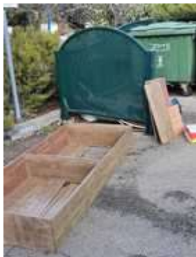
(המשך בעמ' 6)

זהו נושא כואב שלא בא עדיין על פתרונו. ביחיעם, כבכל יישוב כפרי אין עובדי נקיון של הרשות. שמירת הנקיון מוטלת על כל אחד באופן אישי ועל כל משפחה בהיבט החינוכי. בבקשה, אנו קוראים לכולנו לשמור על הבית של כולנו. אנחנו פונים אל ההורים לעצור לאלתר את תופעת פיצוץ בקבוקי הזכוכית על כבישים ומדרכות, זה גובל בסכנה!