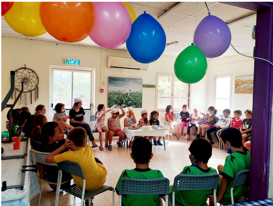
(המשך בעמ' 22)

בחודשי הפעילות הראשונים היו הילדים עסוקים בעיקר בקליטת ילדי א' החדשים ובהעברת את נורמות וכללי המקום. בשבוע שעבר יצאו ילדי המרכזון למבצע מכירת מטבוחה ביתית, כדי לממן לעצמם רכישת ציוד ספורט. אתם מוזמנים להגיע מידי יום ב' בין השעות בין 16:30 – 17:00 למרכזון עם צנצנת מהבית ולמלא אותה במטבוחה משובחת. בשבוע האחרון עוסקים הילדים בחג הקיבוץ. מעיינים בעלונים ישנים, מברכים את הקיבוץ. ביום שישי יעלו למבצר וישחקו בקיבוץ של פעם, כולל נצורים במבצר וכו'. מתכוננים לחופש חנוכה.