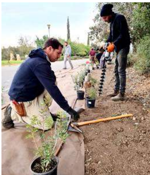
(המשך בעמ' 8)