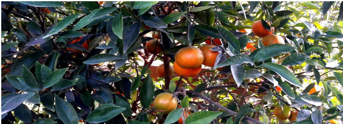
(המשך בעמ' 18)

שנים של בניית העצמאות עם המון סמכות ואחריות. שנים של פיתוח יישובי עצמי ואישי. שנים של צמיחה רוחנית ונפשית, שנים של ביחד של קבוצת אנשים עם עוצמה גדולה (גם לאחר כל המשברים והיו כאלה הרבה).