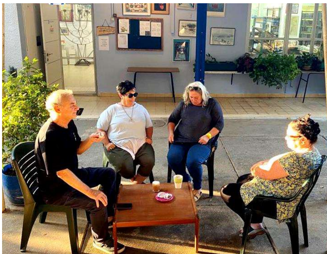
(המשך בעמ' 4)