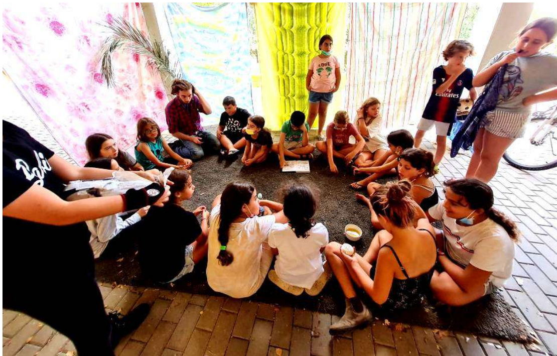
מתוך הפעילות: להציל את האוקיינוסים

בשקד מקדישים חצי שנה לפעילויות בנושא מרכז - איכות הסביבה. כל שבוע מעבירים שני ילדים פעילות לכל הילדים בנושא שהם בחרו, למדו והכינו בתחום איכות הסביבה.