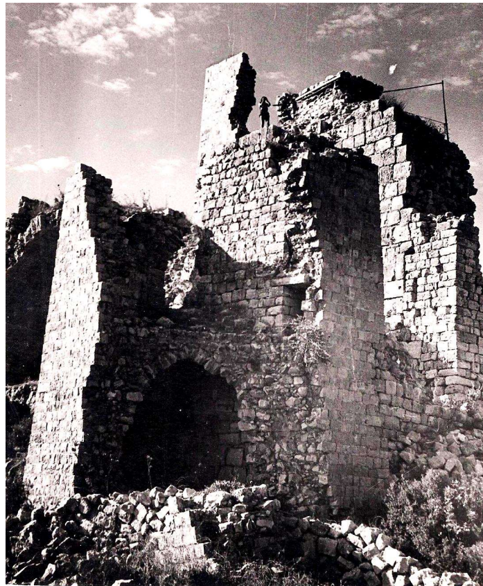
(המשך בעמ' 10)

הקיבוץ נולד לתוך מלחמה קשה ויצא ממנה חבול ופצוע אבל חי.