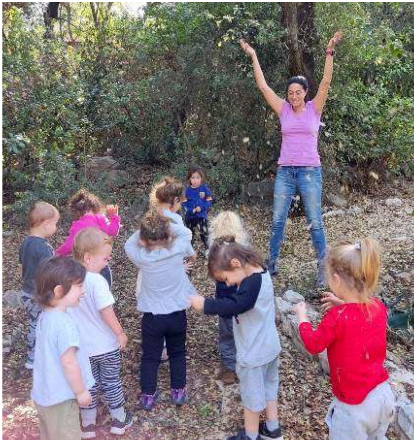
(המשך בעמ' 20)

שנת הפעילות בגיל הרך ונמשכת בשגרה מבורכת. בגיל הרך מתחנכים 73 ילדים, מתוכם מספר ילדים מחוץ לקיבוץ. הפעילות נמשכת על פי התקן הקיבוצי, עם כוח אדם יציב, איכותי וגבוה יותר מאשר נהוג בכלל המדינה. נמשכים הטיולים היומיים ברחבי הקיבוץ, בהתאם לעונות השנה. בימים אלה לומדים ומרגישים את הסתיו ומתחילים בהכנות לחנוכה. בחנוכה מתפקדים כרגיל, במסגרת השגרה המבורכת.