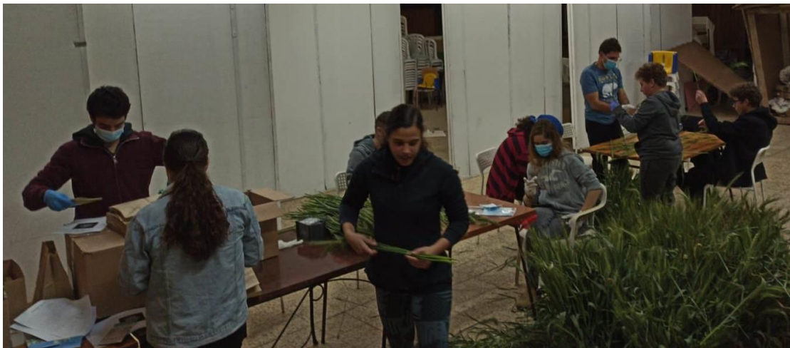
הנעורים בראשות צוות מוראל מכינים אריזות לחלוקה