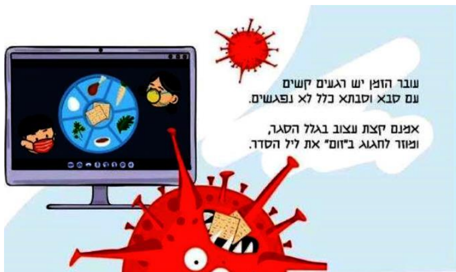
(המשך בעמ' 20)