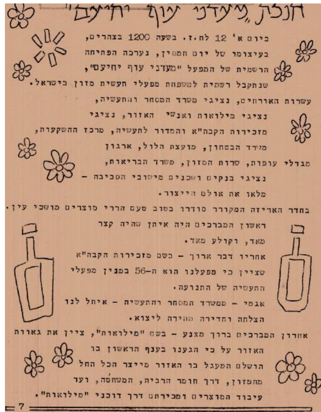
מתוך 'עלון יחיעם', אפריל 1970

תודות לכל העובדות והעובדים בשני הדורות האחרונים, בזכותכם הגענו עד הלום זה המקום לומר תודה ליזמים למייסדים, לעובדי המפעל מאז עתה לחברי קיבוץ יחיעם כולם לבני המשפחות והחברים הקרובים. לתושבי הקיבוץ והאגודה, לילדים, לכולם תקווה לשקט, אחווה ושלוש! בברכה, יוחאי