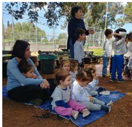
ילדי גן פשוש במסיבת יום העצמאות