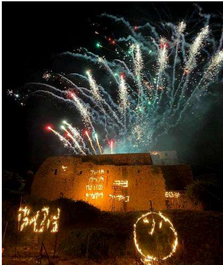
(המשך בעמ' 18)

כמה כיף לחזור ולהתקבץ ואין יותר סמלי בעיני לעשות זאת מאשר עם תחילת הפריחה בטבע לאחר תרדמת החורף כשבאוויר תחושה של התחדשות. את ימי הזיכרון לשואה ולחיילי ונפגעי פעולות האיבה, ציינו יחדיו בטקסים מרשימים על הדשא הגדול. מפקד האש בסיום יום הזיכרון ותחילת חגיגות יום העצמאות ציין את החזרה לשגרה, במופע כתובות מרשים בחסות הנעורים במבצר והזיקוקים המרשימים, תרומת מעדני יחיעם.