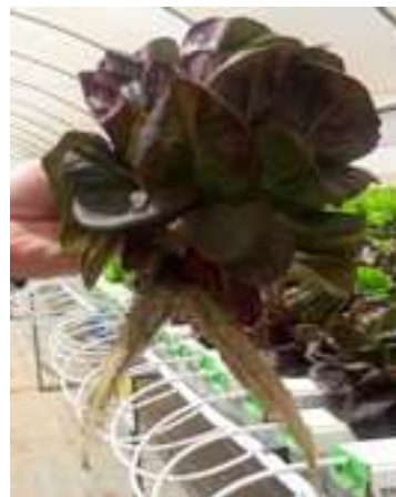
חסה סלנובה. המוצר המבוקש ביותר. גדלה תוך 18 יום

ושלא נתבלבל. לשתילה אין קשר לאדמה. השתילה מתבצעת בתוך חורים שנמצאים לאורך תעלה, שבתחתיתה זורמים מעט מאוד מים, מועשרים בכל המינרלים והמרכיבים הנחוצים. מערכת אוסמוזה מיוחדת עושה מים מזוקקים, שעוברים למיכל שמקבל את ההרכב היחודי של תמיסת הדשן ומזרים אותם בתעלות השתילה. הרעיון לייצר הרכב שנותן לצמח כל מה שהוא צריך.