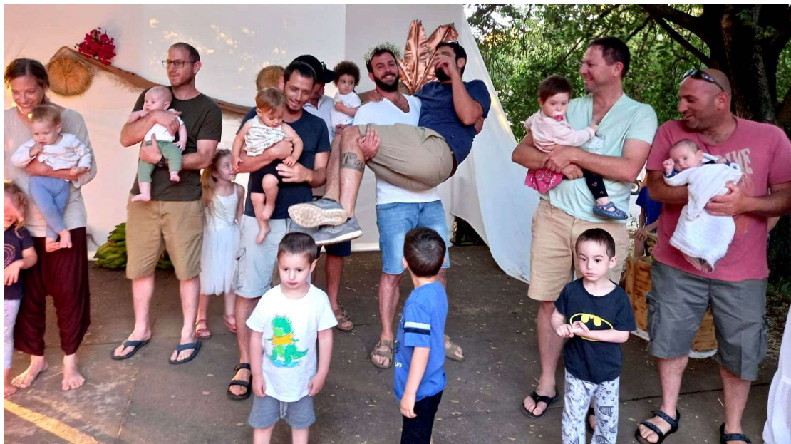
ביכורי השנה שחלפה

הופעה מסורתית של גני הילדים והנעורים וטקס הביכורים השנתי. אני באופן אישי נהנתי לראות את כולנו חוגגים שוב יחד אחרי שנה לא פשוטה.