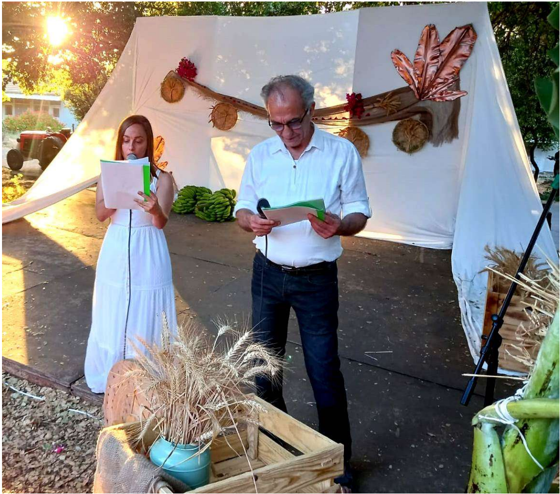
חג ביכרוים כהילכתו, כמו בימים הטובים