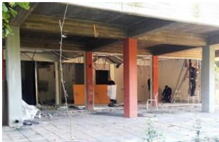
(המשך בעמ' 4)

הקמת מתחם החינוך הבלתי פורמאלי מתקדמת יפה ועל פי התכנון ואנחנו מקווים מאד שגם הפעילות של הילדים במקום תחל על פי המתוכנן ותשדרג את החינוך הבלתי פורמאלי בקיבוץ.