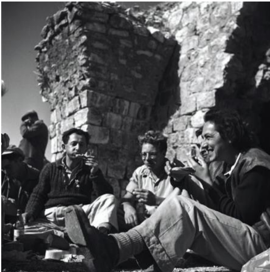
ארוחות ראשונות ב"בית" החדש. 1946

אני מאד גאה בקיבוץ שלנו וגאה מאד במייסדים, שמבלי לדעת זאת דאגו לדורות קדימה למקום המופלא הזה. אי אפשר להתייחס ליחיעם ולאהוב את המקום מבלי להתייחס לימים הראשונים של המקום ולמייסדיו. זוהי ההשראה שצריכה ללוות איתנו הלאה. גם מי שראה בבואו לכאן עניין זמני, לא יכול היה להעלות הדעת שנשב פה כבר 74 שנים במקום שרק גדל, מתפתח ומשתדרג והנה אנחנו פה. יולדים ילדים, בונים ומרחיבים. ממליץ לכולם לעלות למבצר בכל הזדמנות אפשרית, להשקיף על הקיבוץ הטובל בירק, להשקיף מזרחה ולהפנים את עוצמת המקום.