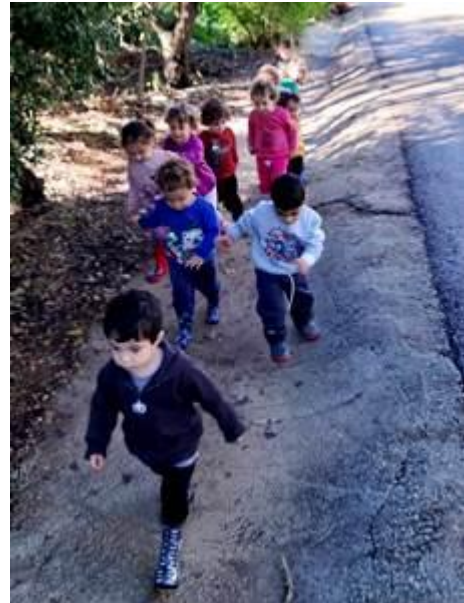
גן אנקור בטיול חורף

אנחנו מתרגלים להתנהל על פי הנחיות הקורונה, כמו למשל קיום חגיגות ללא השתתפות הורים וכדומה, מה שמאד חסר לנו ואנחנו מייחלים ליום שבו יוכלו הורים לחזור ולהיות שותפים מלאים לפעילות. חנוכה למשל, תצויין באירוע מיוחד בכל אחד מהגנים והפעוטונים, אך כמובן, ללא השתתפות ההורים.